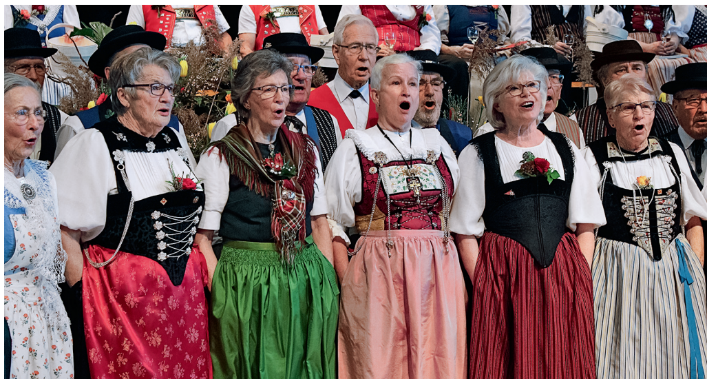
Vortrag der Veteraninnen und Veteranen der freien Jodlervereinigung am Zürichsee.

Für 75 Jahre wurden das Jodlerdoppelquartett des TV Elgg, der Jodlerklub Herisau-Säge und das Jodelchörli am Pfäffikersee, Pfäffikon ZH, für