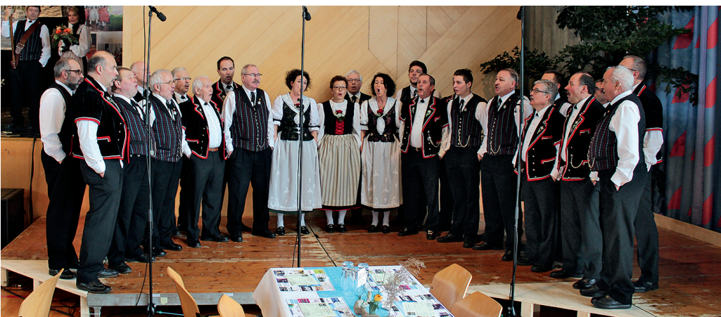
Die Stadtjodler Gossau und der Jodlerklub Klein-Rigi beim Vortrag für die beiden neuen Ehrenmitglieder.