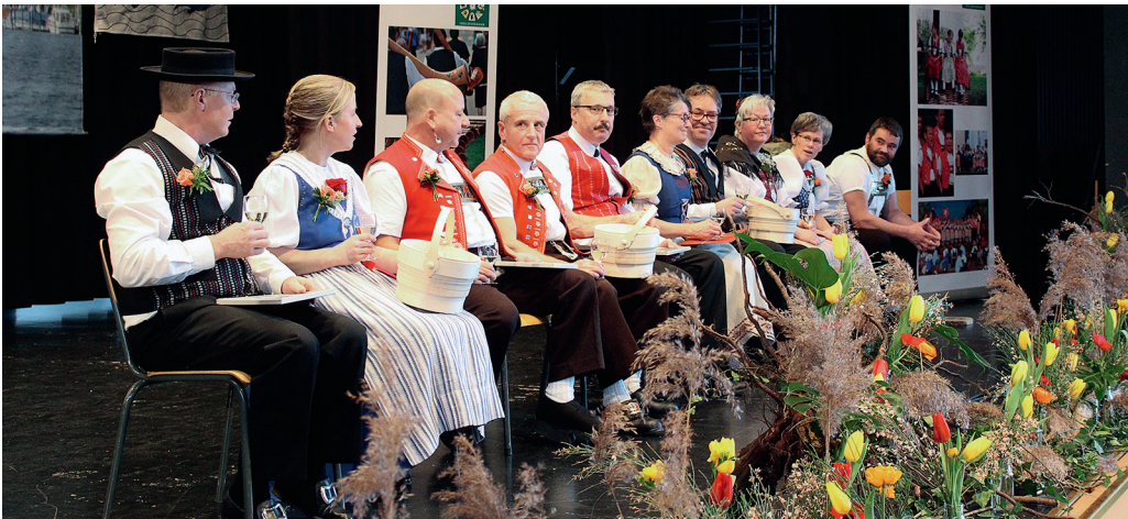
Die Vertreter der geehrten Gruppen.